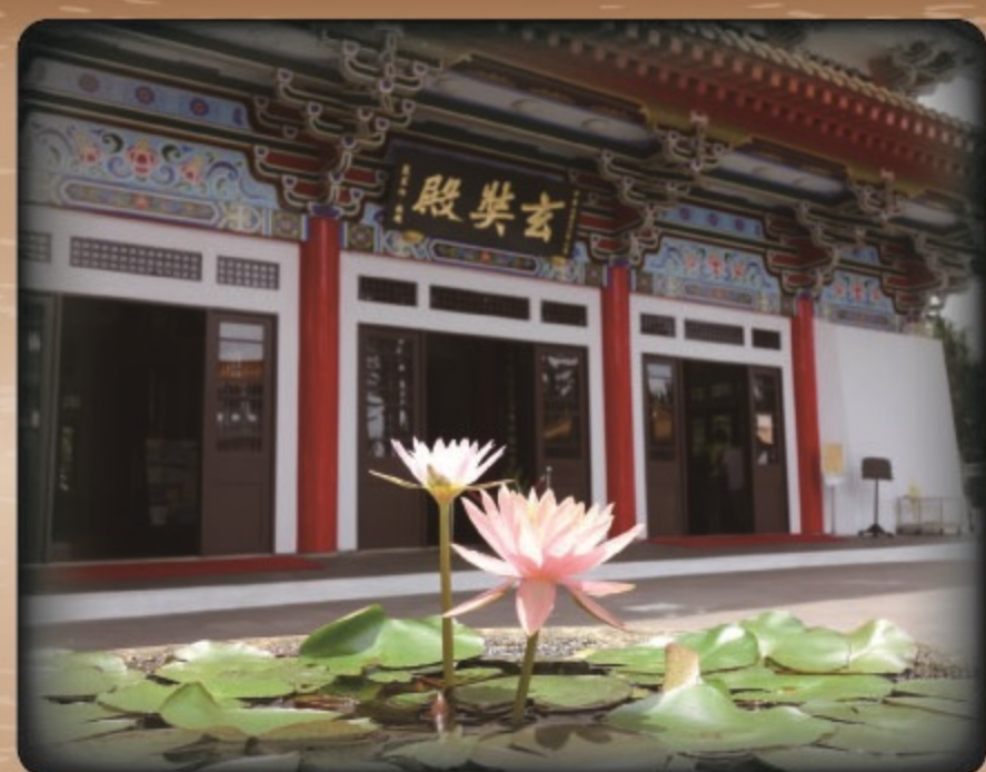
▲民國44年恭迎玄奘大師靈骨舍利來台，現供奉於日月潭玄奘寺

先天、龍華、金幢三派皆尊羅祖為其師祖，都奉羅祖的生日和忌日，三派可謂同源異流。至於三派教義與儀禮大同小異，三派在早課讀誦《金剛經》，晚課念《阿彌陀經》，先天派另外中午加誦《心經》。其信仰對象主供觀音菩薩或釋迦牟尼佛為本尊之外，龍華派以阿彌陀佛(三聖佛)、關聖帝君為本尊。金幢派以阿彌陀佛及本派教主為本尊。三派祭祀除了以上佛菩薩外，也有奉祀三官大帝。龍華派另外配祀太子爺、媽祖、註生娘娘，三派均混雜儒家思想、道家思想，儒、釋、道三教不分。