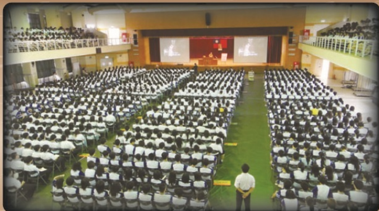
▲台灣佛教校園品德演講