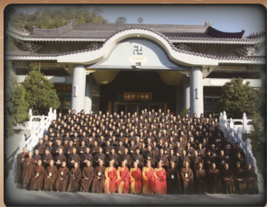
▲傳授在家五戒菩薩戒會合影

大陸僧侶從流離到安頓，在優勢的政治保護局面下發展，中國漢傳佛教在台灣成為佛教主流，民國三十九年在政府的授意下，成為台灣佛教的最高領導機關「中國佛教會」即是其例。從民國四十二年，白河大仙寺開始傳授三壇大戒，後歷年由教會傳戒，使台灣佛教漸注入了大乘僧伽的新血。民國四十四年十一月，玄奘大師部份頂骨舍利由日本五位高僧護送迎回台灣日月潭奉安所供