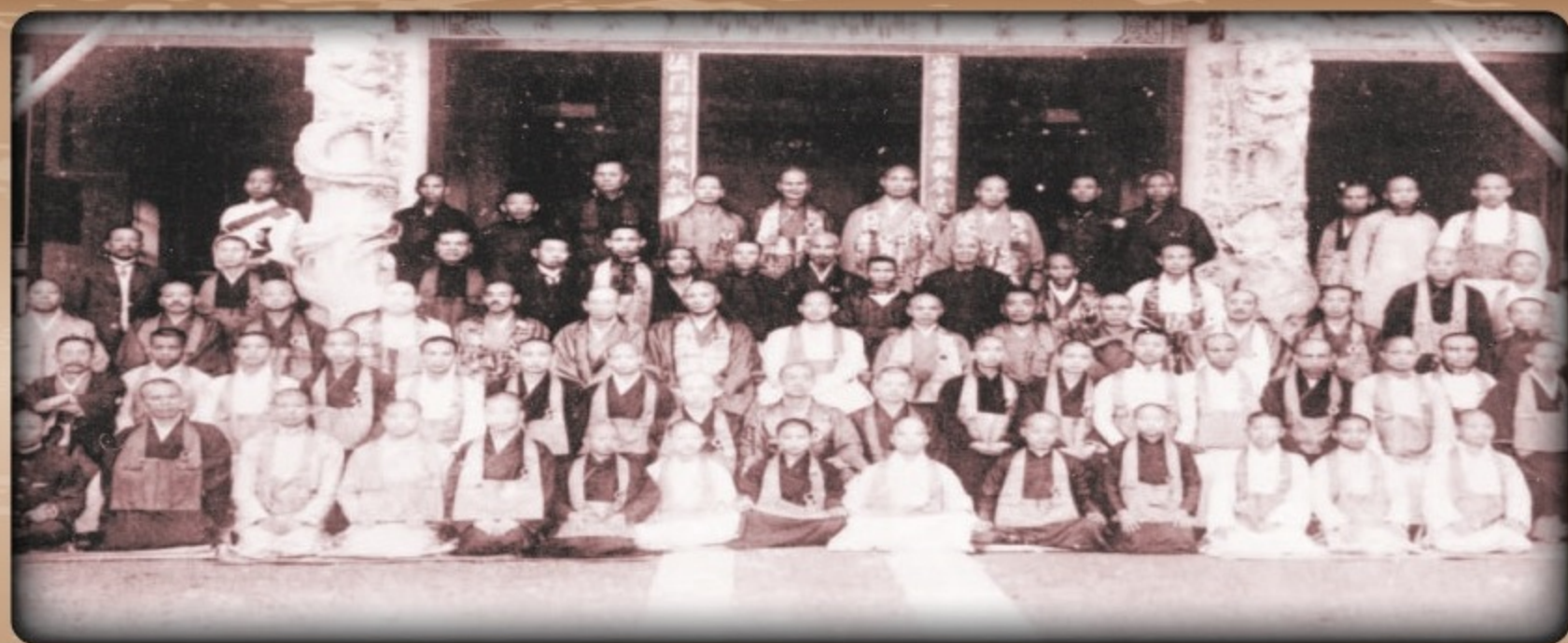
▲日據大正6年「台灣佛教中學林」開學典禮