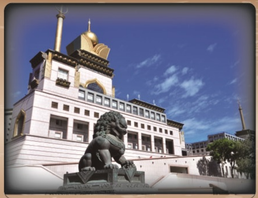
▲中台禪寺