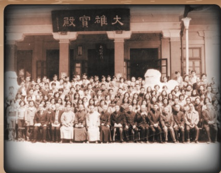
▲中國佛教會主辦之大專青年佛學講座合影

大正六年(西元1917年)「台灣日本曹洞宗」別院創設「台灣佛教中學林」，日本欲以懷柔政策，教育台灣僧侶，為台灣佛教辦學