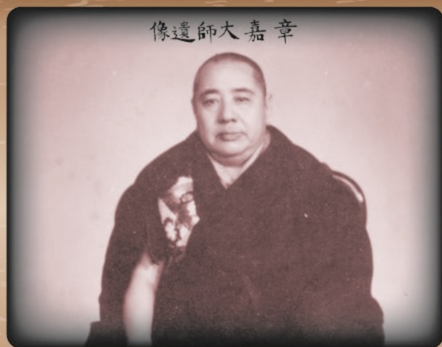
▲章嘉大師法相

台灣是個海島，多颱風、地震，居民受自然界的威脅，在人力不能抗避的情況下，自然容易形成多神教的信仰，既信佛又拜神，使得整個佛教界充滿神話的色彩。乃至，後清