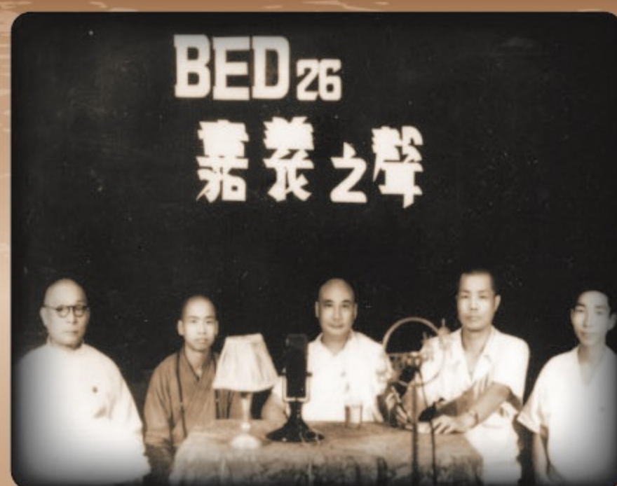
▲慈航法師開廣播弘法之先驅