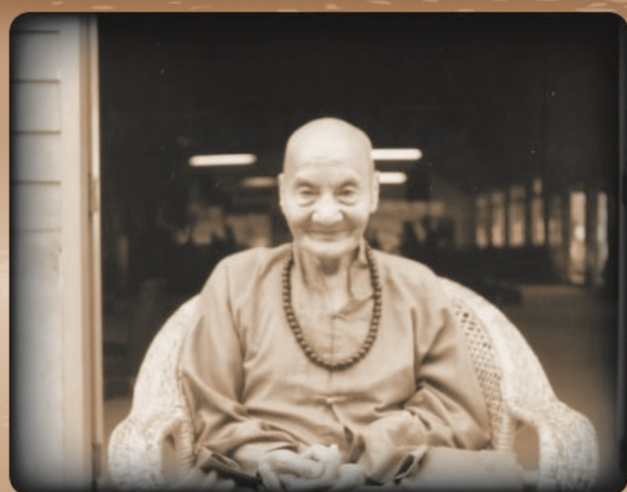
▲叫人「老實念佛」的廣欽法師