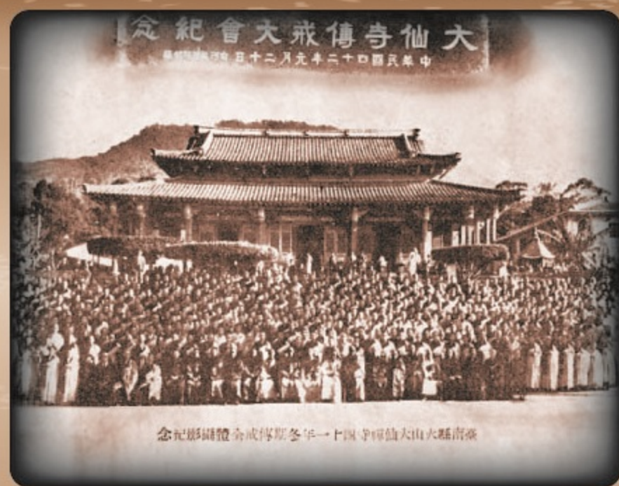
▲民國42年「大仙寺」傳戒