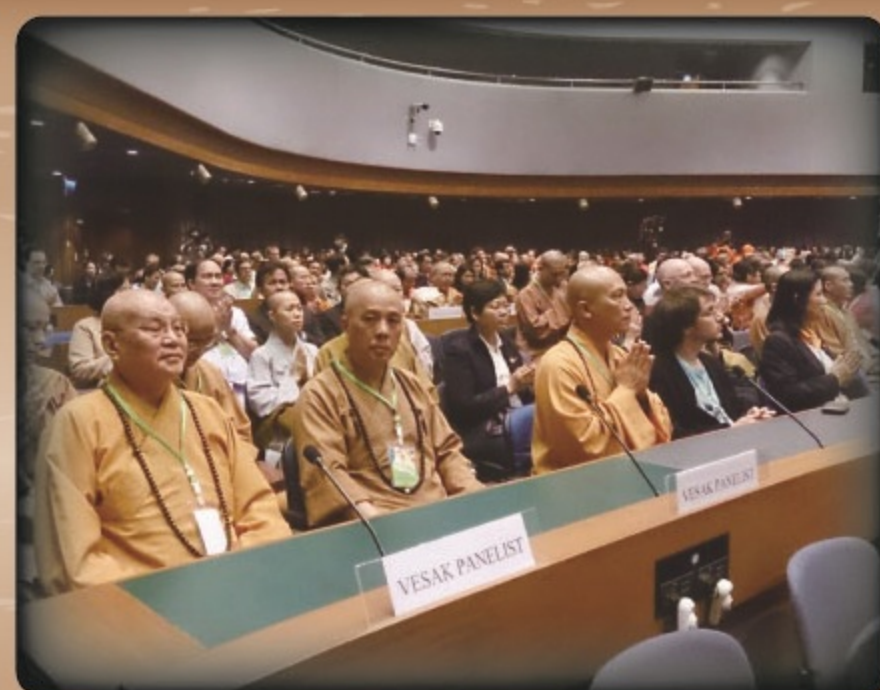
▲台灣佛教參加聯合國慶祝衛塞節 會議