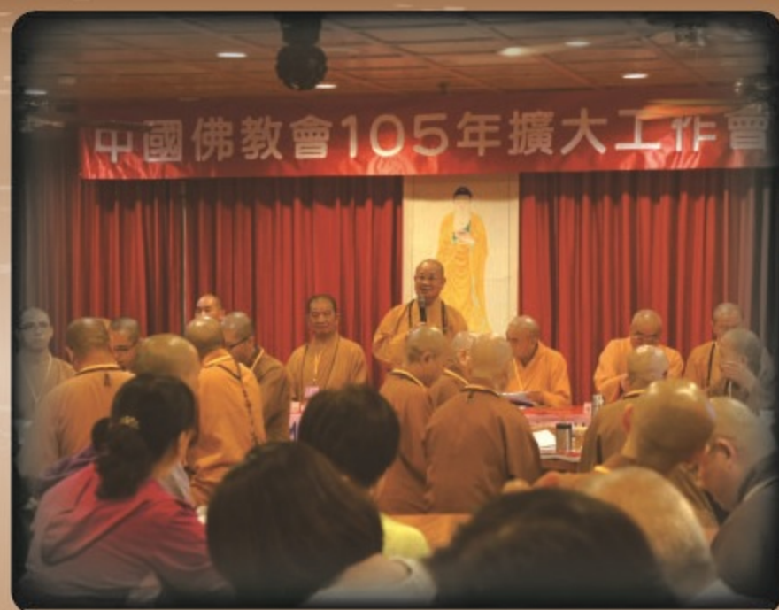
▲中國佛教會-工作會報會議