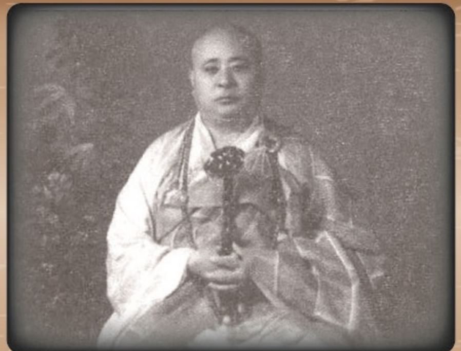
▲白聖長老